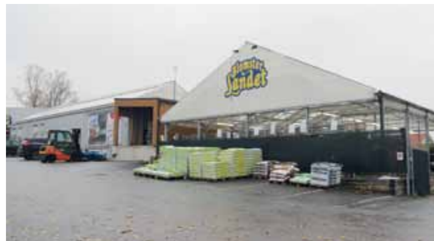
Blomsterlandet flyttar till Arninge.

Täby kommun inbjöd till dialog den 17 oktober och 21 oktober angående ny detaljplan för kv. Trädgårdsmästaren 1 och 2 (rödhusen) och kv. Träget 14 (Blomsterlandet) i Ellagård.