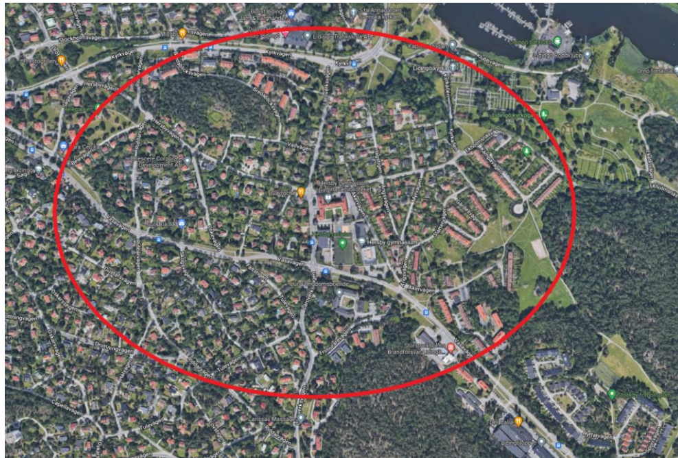
Figur 1. Avgränsning för inventering och åtgärder.

Befintliga regleringar på västra och östra sidan från Hersby gymnasium illustreras i figur 2 och 3 med streckade linjer. Med en ny reglering innebär det att staden övergår från datumparkering till servicegator i området.