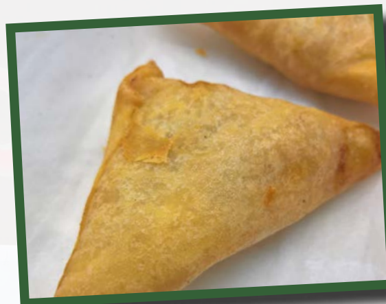
Sambosa på Samias vis.