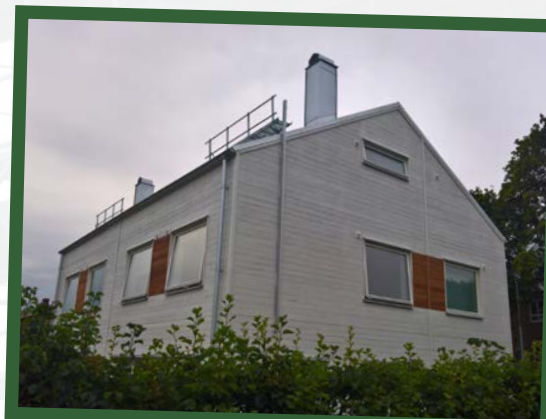
Nybyggen på hörntomten Arrendevägen-Sundbyvägen.