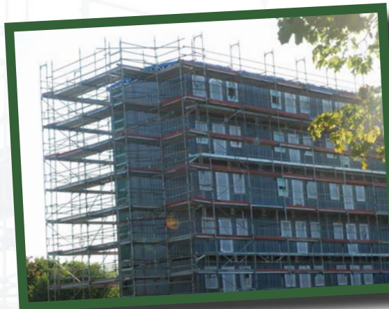
Studentbostäder byggs vid Bromstenvägen.