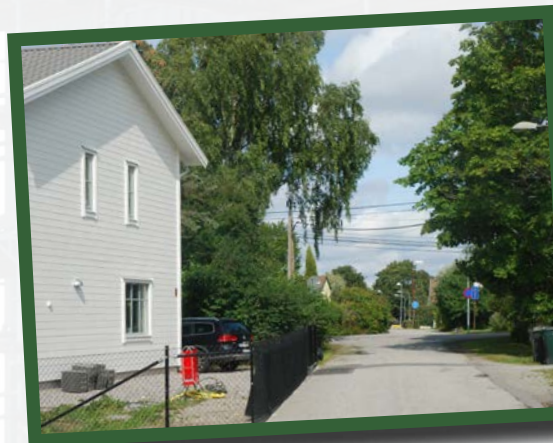
Årets nybygge vid Ägostigen blev möjligt sedan staden sålt gatumark.

Många befarar en bostadsbubbla, men än går Stockholms bostadsbyggande på högvarv. Detta märks även i Sundby, där bebyggelsen förtätas genom rivningar/avstyckningar. Att fler bostäder byggs, uppskattas av Stockholms stad, som under året sålt gatumark till två fastighetsägare vid Ägostigen. Fastigheterna blev då så stora att de kan avstyckas. Hittills har därmed ett nytt hus tillkommit, samtidigt som Ägostigen blivit smalare. Årets stora omvandling sker i kvarteret Minken, längs Arrendevägen norr om Sundbyskolan, där två enbostadshus rivits, för att ge plats åt två parhus. Dessutom byggs bostadshus på tidigare trädgårdsmark bakom, där tomter avstyckats. Omkring årsskiftet väntar ytterligare rivning/nybyggnad på fastigheten längst ner i kvarteret. Exploatören är genomgående densamme. De nya husen kommer från en småländsk trähustillverkare, som levererar monteringsfärdiga element, dock anpassade efter lokala önskemål.