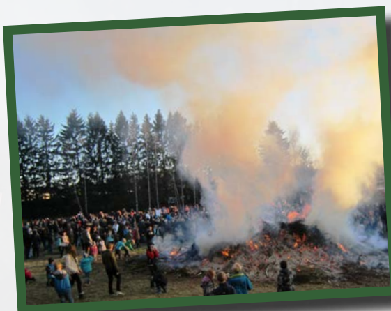
700 personer kom och gick under kvällen.

Under kvällen kom och gick minst 700 besökare. Bland sidoaktiviteterna fanns kaffeservering, porslinskrossning, fiskdamm och grill. En kör stämde upp med vårsånger. Ansvariga var Spånga Hockey team-03, Sundby Egnahemsförening och Flysta villaägareförening. Flera dygn efteråt låg en glödhet askhög kvar och pyrde. Sedan återtog snart naturen den eldhärjade markplätten. I augusti växte där blommande solrosor, tistlar och jordärtskockor.