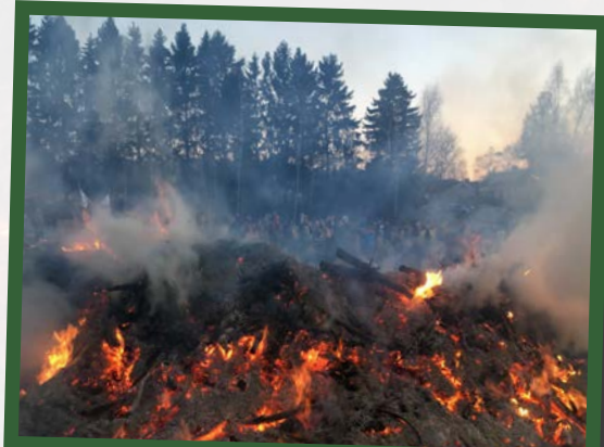
Ingen rök utan eld.